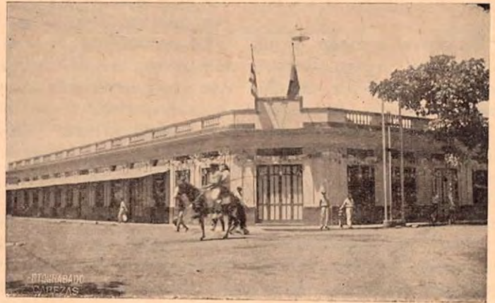
Edificio de la Terraza, uno de los edificios en la calle del comercio, más elegantes del Puerto.

Visite por eso la Tienda y Zapatería LA FAVORITA