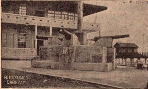
Monumento de los Cañones en el Paseo Guevara en Puntarenas.