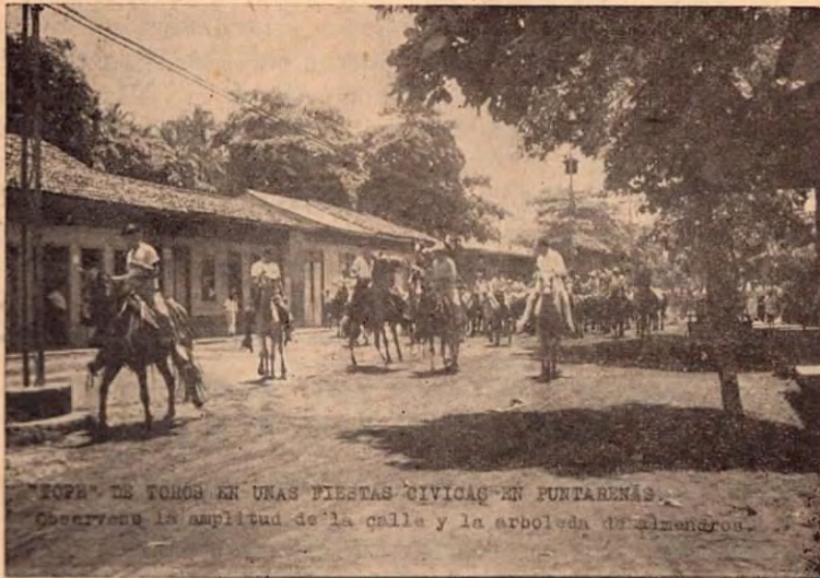
Un "tope" de toros en Fiestas Cívicas de Puntarenas.